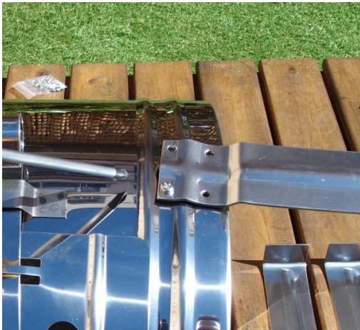
Vista desde el exterior