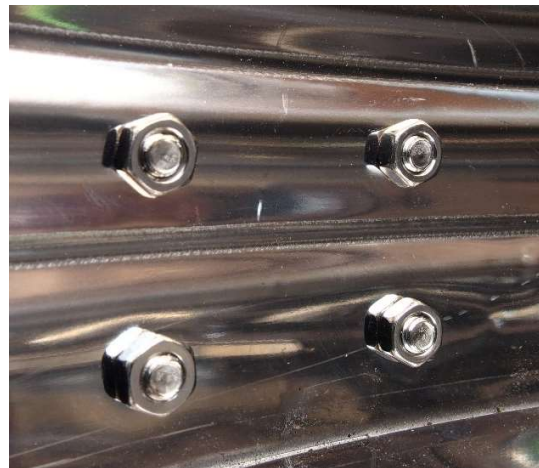
Vista desde el interior

Una vez las patas estén montadas se puede montar la chimenea. La primera pieza es el codo, seguida de los dos tubos, que son iguales. Por último, está el tejado.